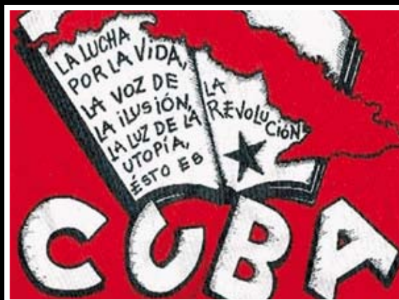
Estas son algunas de las ilustraciones que acompañan a varios de los blogs escritos por cubanos con más visitas.